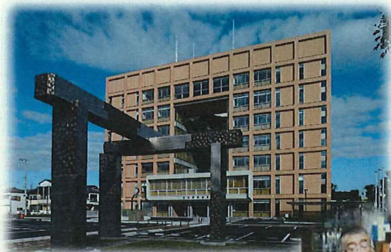
モニュメント「記憶としての構造 2015」